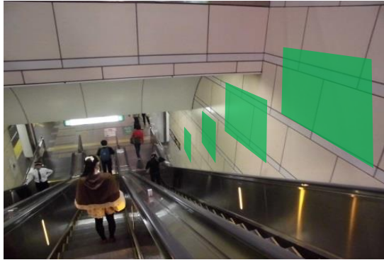
【 掲出イメージ 】